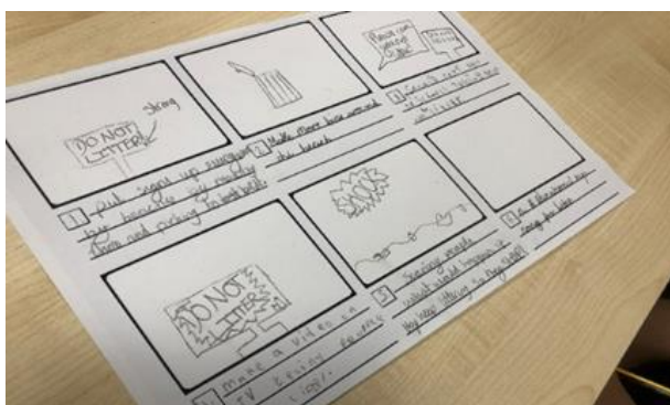
Delwedd: Gwaith plant ar negeseuon sbwriel.

"Hoffwn weld mwy o finiau ailgylchu ar y traeth er mwyn i bobl allu eu defnyddio" (Disgybl Bl. 6)