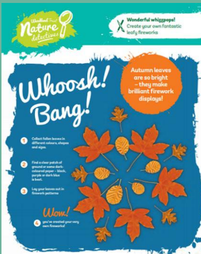
Tân gwyllt dail

Rhai syniadau ar gyfer defnyddio coed a choetir ar gyfer gweithgareddau creadigol a chyffrous