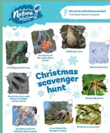
Helpa sborion Nadolig

Mwy o ddeunyddiau ar gael yn adrannau adnoddau gwefannau Cyfoeth Naturiol Cymru a Coed Cadw .