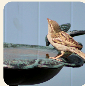
Dŵr ar gyfer bywyd gwyllt