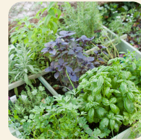
Blodau neu berlysiau