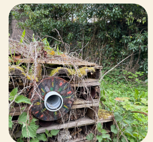
Gwesty bwystfilod bach