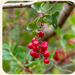
Planhigion gydag aeron